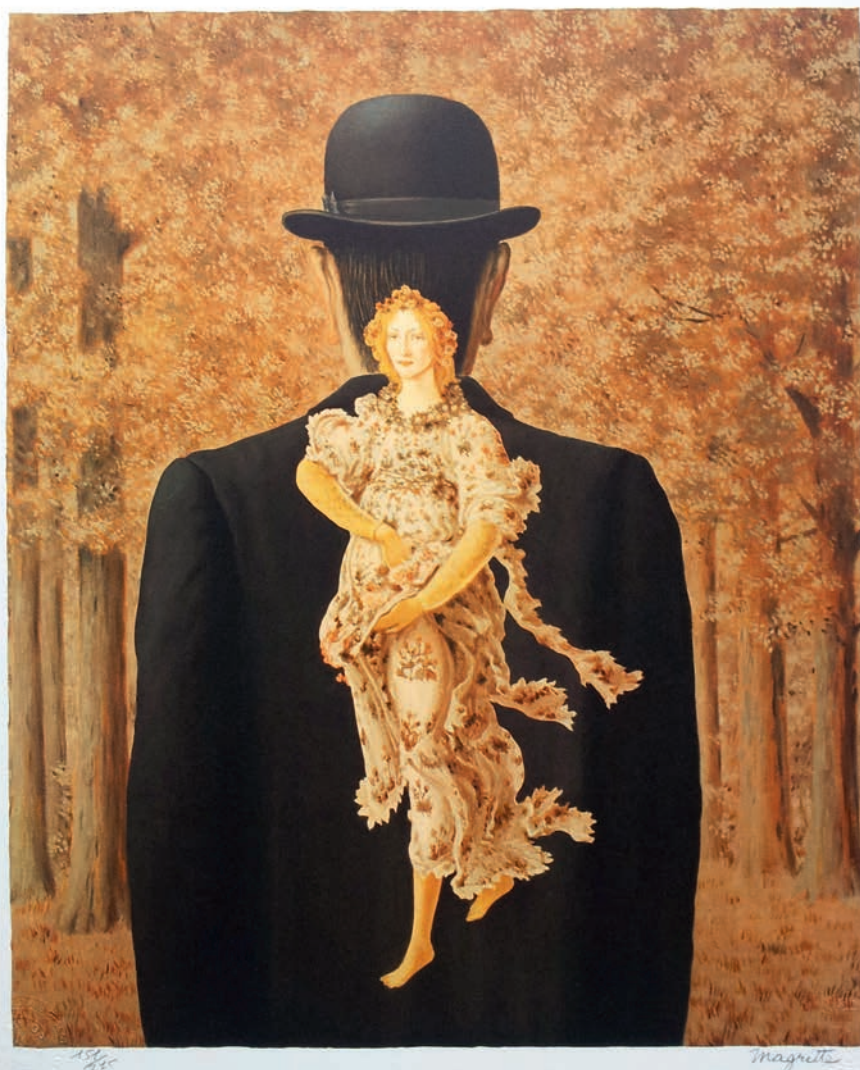
Le Bouquet tout fait