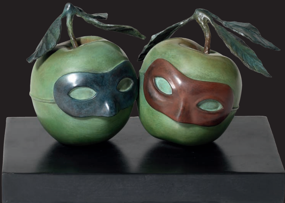
La Valse Hésitation